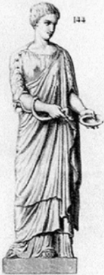
HYGIE Statue au Musée de Louvre.

POITIERS Hôtel Berthelot Salle Crozet = 24 rue la chaîne Faculté des Sciences Humaines et Arts = Université de Poitiers