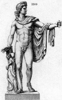
APOLLON DU BELVEDÈRE Statue au Musée de Vatican.