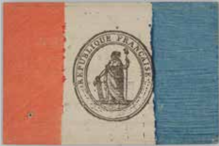
Carte d'électeur du Maine-et-Loire, 1797 (1 L 335).

Avec la Révolution, les Français cessent d'être des sujets pour devenir des citoyens. Affirmé dans la Déclaration des Droits de l'Homme et du Citoyen, le principe de la souveraineté de la Nation est inscrit dans la Constitution qui met fin à la monarchie absolue. Néanmoins ce texte restreint le suffrage à une minorité d'électeurs élus par des citoyens actifs payant un impôt équivalant à 3 journées de travail, le cens. C'est le suffrage censitaire.