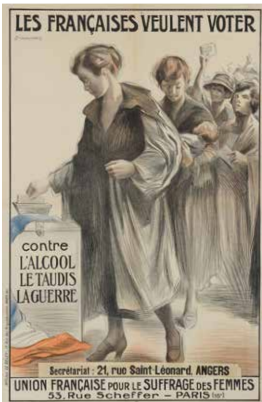
► Document 5. « Les Françaises veulent voter », UFSF (1909-1914), (7 Fi 1041).

Souvent évoqué, le droit de vote n'est accordé aux femmes que tardivement en France. Au XIX e siècle, le mouvement des suffragettes y reste limité. La question du vote des femmes divise les associations féministes. Elle concerne alors avant tout des femmes cultivées, des intellectuelles. Dès 1917 pourtant, des propositions prévoient, en vain, de récompenser l'immense effort économique des femmes pendant le conflit par un droit accordé aux plus méritantes. Pendant l'entre-deux guerres, six propositions de loi votées par l'Assemblée sont rejetées par le Sénat qui juge les femmes trop influençables. C'est le général de Gaulle, chef du gouvernement provisoire, qui signe l'ordonnance du 21 avril 1944. Les premières élections mixtes au suffrage universel montrent une forte participation des femmes, de 2% supérieure à celle des hommes...